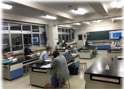
<学校運営委員会の様子>