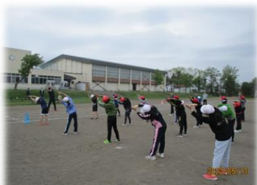
<体育「はましんダンス」>