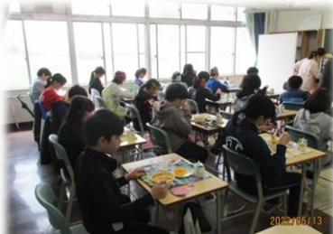
<中学校での給食 「パスタの量がいつもより多いよ」>

大麻東中学校区（大麻東小学校・大麻泉小学校・大麻東小学校）が、5月13日（金）に今年度1回目の6年生中学校登校を実施しました。今回は、大麻泉小学校の児童が中学校の授業と給食を体験しました。この中学校登校は、義務教育9年間を見通した「一貫した指導」と「系統的な指導」を可能とする「相乗的・補完的な指導」の重要な取組の一つとなります。特別支援学級の合同授業では、中学生が小学生に優しく声をかけてあげる場面が見られました。体育科の授業では、中学校の先生オリジナルの準備体操を一年早く教えてもらい、とても楽しそうに体を動かしていました。また、短距離走で速く走るためにはどうしたらよいかを皆で考え、指導してもらったことを自分の走りに生かしていました。授業中の子ども達の目の輝き、意欲的に学習に取り組む姿が印象的でした。6月には大麻東小学校の中学校登校体験が行われる予定です。