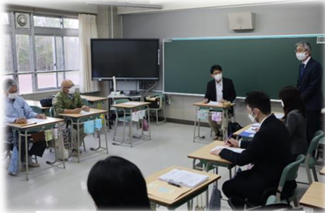
<学校運営委員会の様子>