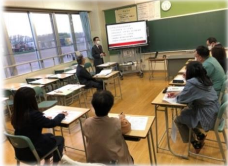
<学校運営委員会の様子>