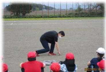
<スタートの姿勢・足の位置>