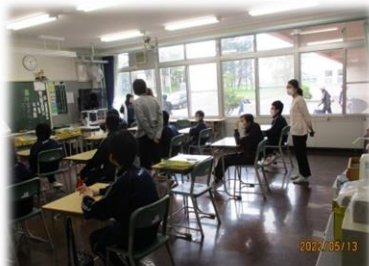
<特別支援学級合同授業>