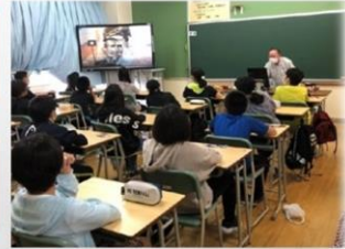
<中央中校区の小中一貫教育について> (※当日の資料から)