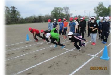
<真剣に練習する子ども達>