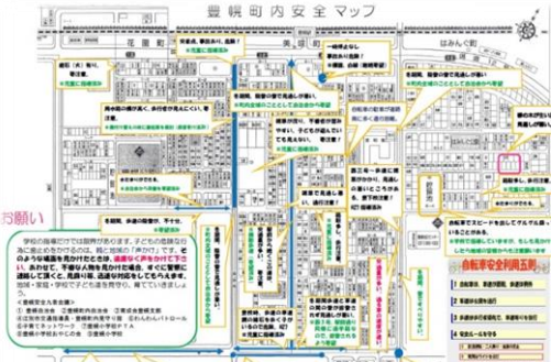
<豊幌小校区 安全マップの検討>